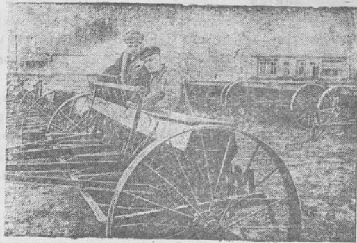
ROSTOVO SRITIS. Salsko rajono Stalino vardo kolektyvinis ūkis, ruošdamasis pavasariniam laukų darbams, atremontavo visus žemės ūkio įrankius ir paruošė sėklas.