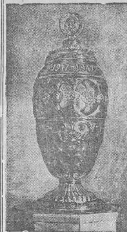
Didžiosios Spalio socialistinės revoliucijos 30-ųjų metų ir naujų metų proga latvių tauta įteikė draugui J. V. Stalinui sidabrinę vazą.

VKP(b) CK vasario plenumas savo nutarime „Dėl priemonių žemės ūkiui pakelti pokariniu laikotarpiu“ išskėlė partijai, visai tarybinei liaudžiai uždavinį trumpiausiu laiku ne tik gausiai aprūpinti gyventojus žemės ūkio produktais ir