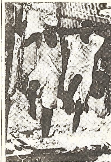
SUDANAS. Merengano medvilnės valymo fabriko ceche.