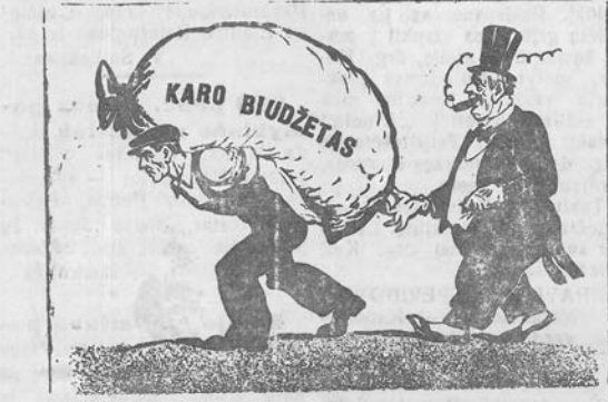
Kapitalistas: - Drausiau Mes drauge nešame mokesčių našią. S. Čištakovo pieš. TASS'o spaudos klifė

LONDONAS, VII. 9 d. pasakė idas, - nutarė, kad, jeigu liepos 11 dienos rytą uosto darbininkai neatvažiuos visų be išimties laivų įskrovėms, ji patars karaliai paskebliti nepaprastą padėtį sutinkamai su vyriausybės nepaprastų įgaliojimų akto, „Vyriausybė, -