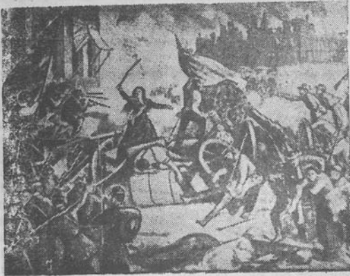
Paryžiaus Komuna 1871 m. Rotušės gynyba.

dalyvius. Į Barselono uostą atvyko 40 laivų eskadra. Be to, iš Madrido atvyko stambus policijos junginiais. (ELTA).