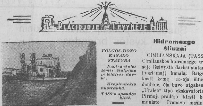
VOLGOS-DONO KANALO STATYBA Nuotrąuko: žemės išpūpimo prėtėtais dar-br. Kroplenicko nuotrąuka. TASS'o spaudos klėse.

Kolūkiečiai, laiku ir aukštu agrotechnikos lygiu paruoškė žemę žiemėnėiams, nes tinkamai įdirbti pūdy-mai — aukštų derlių laidas!